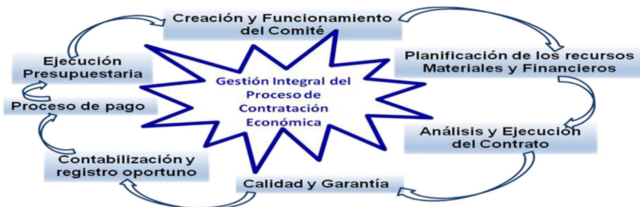
Figura 1. Enfoque sistémico de la contratación económica

En la medida que se perfeccione la utilización de los contratos, su calidad, así como se analicen las principales deficiencias en su confección, se puede contribuir mejor al cumplimiento de la gestión (Valdés Domínguez, 2011; Blanco Valdes, 2016). Los autores consideran que la contratación económica es un hecho económico que comienza desde una previa negociación hasta la ejecución de la oferta contractual, evidenciándose una relación comercial entre dos o más personas naturales y jurídicas que se define legalmente, acordado por las partes y cumpliendo con las normas jurídicas estipuladas en una pro forma contractual en el cual se declaran las obligaciones de las partes, para el cumplimiento y satisfacción de las necesidades demandadas (Barrionuevo, 2018; Ortiz Díaz et al., 2023). En la figura 1, se muestra la importancia de considerar la contratación económica con un enfoque sistémico, que relacione y entrelace la gestión por proceso, la gestión de la calidad y el control interno, con la concepción de integrar el proceso desde la creación del comité económico, su funcionamiento, planificación de los recursos materiales y financieros, análisis y ejecución del contrato velando por la calidad, hasta la contabilización, registro oportuno, pago de la compra de Bienes o Servicios y ejecución presupuestaria.