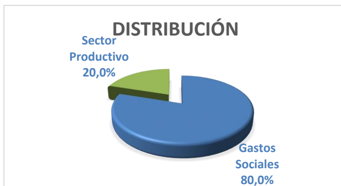
Gráfico 4 Resumen de la distribución de la Contribución Territorial (U/M – MP)

Esta acción no fue dirigida al desarrollo económico en particular y contempla solo un 20 por ciento hacia sectores productivos que, con su propio perfeccionamiento de la tecnología, los servicios, etc., generaran un incremento de estos ingresos en tal tributo, que pueden emplearse con mayor potencialidad hacia el sector social.