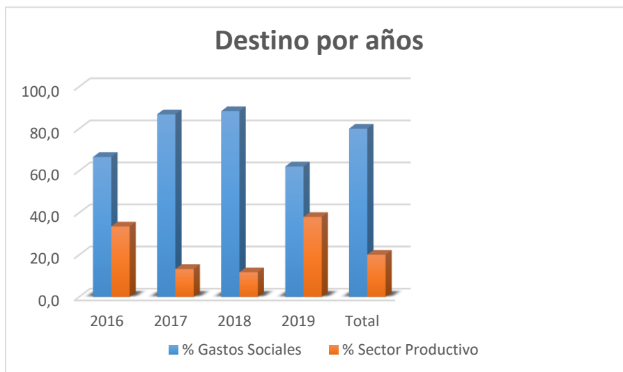
Gráfico 5 Destino de lo recaudado por concepto de la CTDL (U/M - MP)