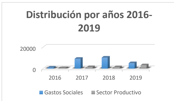
Gráfico 3 Distribución de la Contribución Territorial (U/M – MP)