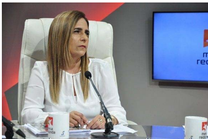
Es un balance de ingresos y gastos a nivel de país, en el cual, con los ingresos que se prevé recaudar y otras fuentes de financiamiento, se respaldan el sostenimiento de los servicios públicos.

“A pesar de las limitaciones financieras Cuba destinará alrededor de 64 mil millones de pesos para la sostenibilidad y desarrollo de las conquistas alcanzadas en los servicios sociales, al financiamiento a productores nacionales por la sustitución de importaciones, y a la inversión en viviendas, obras de infraestructura y sociales; lo que demuestra el carácter humanista de nuestra sociedad”.